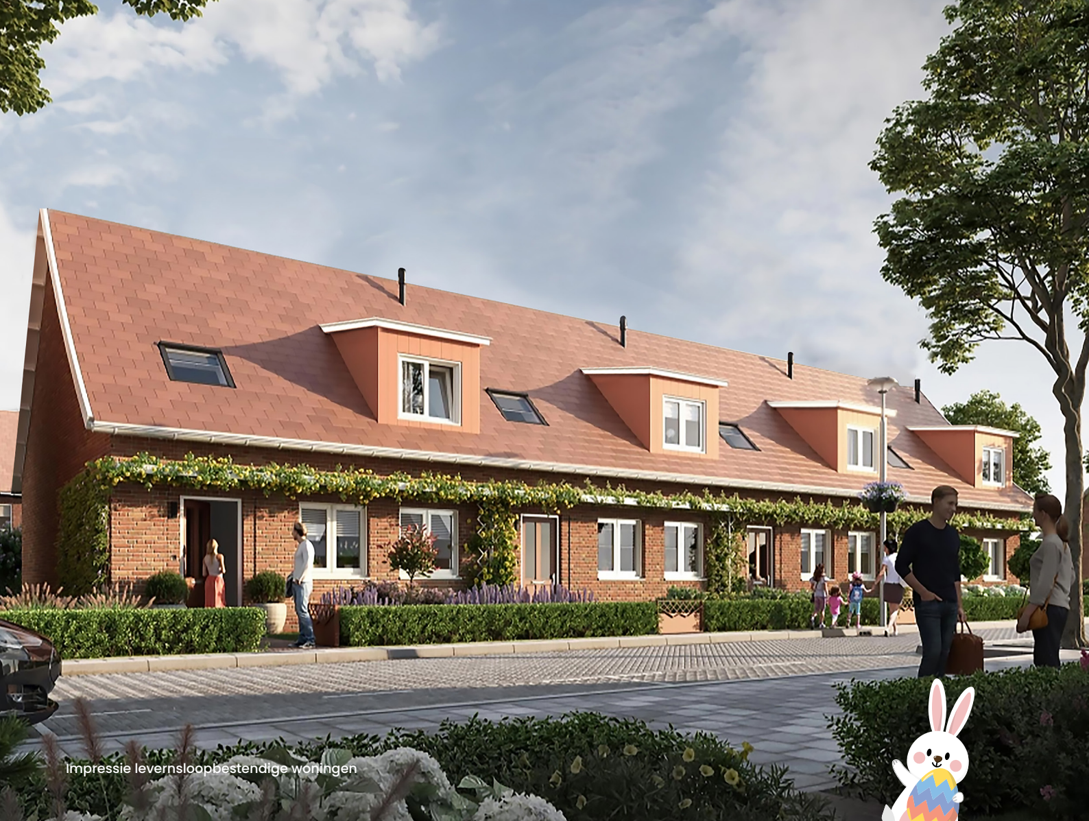
Impressie leversloopbestendige woningen